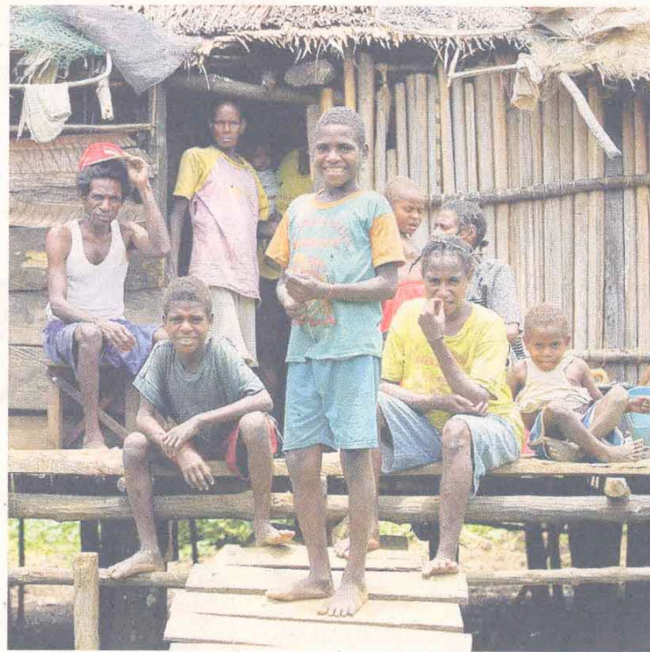
T-Shirts und Shorts – meist billige Massenware – waren bislang die Kleidung der Asmat auf Papua Neuguinea.